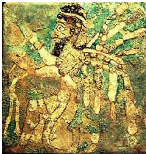
یکی از آجرهای لعابدار کشف شده در قلاچی در موزه ژاپن

بوکان هویت تاریخی خود را از (قلعه باستانی قلاچی) در مجاورت روستای قلاچی در هشت کیلومتری شمال شرقی بوکان می‌گیرد؛ که بازمانده یکی از مراکز بسیار مهم تمدن (ماناها) در هزاره اول پیش از میلاد مسیح در حوزه شمال غرب ایران که برخوردار از تمدن و قانون بودند؛ است. حاکمان قلعه تاریخی قلاچی معبد این قوم متمدن بودند که نزدیک به سه هزار سال پیش مدت زمانی در این ناحیه سکونت و حکم رانی کرده‌اند و آنچه از اجزای معماری این تمدن کهن در این قلعه باستانی به دست آمده با تمدن‌های مشابه و هم زمان خود از جمله (حسنلو (در نقده و) زیویه (در سقز که از نظر جغرافیایی با قلعه (قلاچی) هم حوزه‌است، قابل مقایسه و برابر دانست به گونه‌ای که آثار معماری مکشوفه از نظر مشخصات و نقشه بیش از هر چیز بیانگر یک معبد بزرگ است.