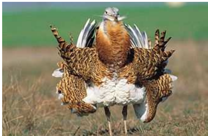
پرنده نادر میش مرغ

کبک، کبک‌چیل، عقابها، شاهین، بحری، بالابان، لیل، دلجه، انواع جغد، کرکس‌مصری، دال، حواصیل‌ها، لکلک سفید، غاز خاکستری، اردک‌سرسبز، خوتکا، فیلوش، اردک‌ارده‌ای، آنقوت، غازپیشانی‌سفید، قره‌غاز، کشیم‌ها، اکراس، کاکاتی‌ها، انواع پرستوهای دریایی، سار، انواع دارکوب، چنگر، سبکبالان و میش‌مرغ می‌باشد.