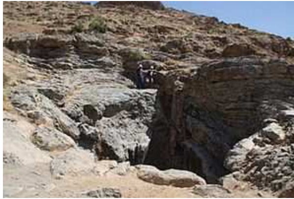
محدوده بیرونی غار زیرزمینی قلاچی