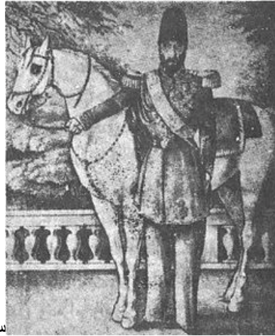
سردار عزیز خان مکری