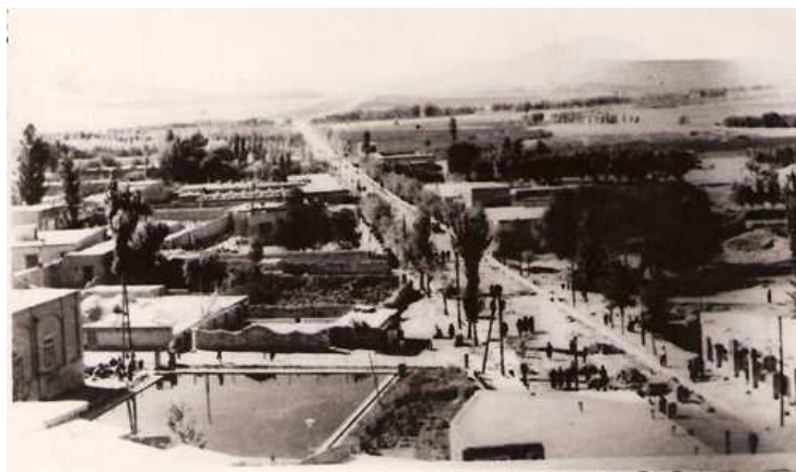
بوکان سال 1330

ین شهرستان در حدود ۳۰۰۰ سال قبل تحت نام ایزیرتو پایتخت تمدن مانناییان بوده است. آثار این تمدن بسیار هنرمند قابل توجه بوده و نمونه‌هایی از آثار به تاراج رفته اش در موزه‌های جهان از قبیل موزه توکیو و موزه ارومیه دیده می‌شود. این تمدن در شمالغربی ایران سکنی داشته‌اند. هنر معروف آنها ساخت آجرهای لعابدار بوده است. آجرهای با طرح‌های رنگین که طرح آنها پس از گذشت حدود ۳۰۰۰ سال تقریباً سالم باقی مانده‌اند. نمونه‌ای از این آجرها در موزه شرق کهن توکیو یافت می‌شود. کشفیات هیئت باستان‌شناسی در سال ۱۳۵۰ و مطالعات پس از آن نشان داده منطقه بوکان از قدیم پادگان اشکانیان و ساسانیان بوده است. آثار باستانی زیادی که در این منطقه به دست آمده مؤید همین نظریه است.