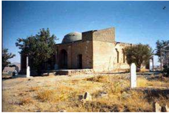
نمای مسجد حمامیان

در مسجد حمامیان واحدهایی تحت عنوان مدرسه متصل به این بنا ساخته شده